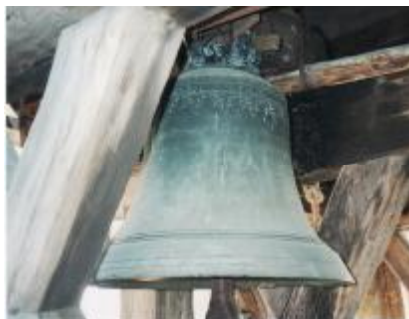
Najmenší zvon - umieráčik