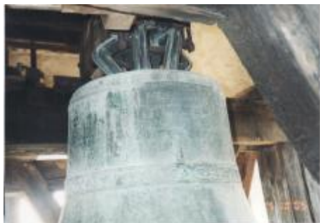
Veľký – plačúci zvon